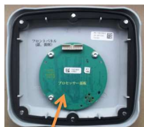
④ フロントパネル内側の プロセッサー基板